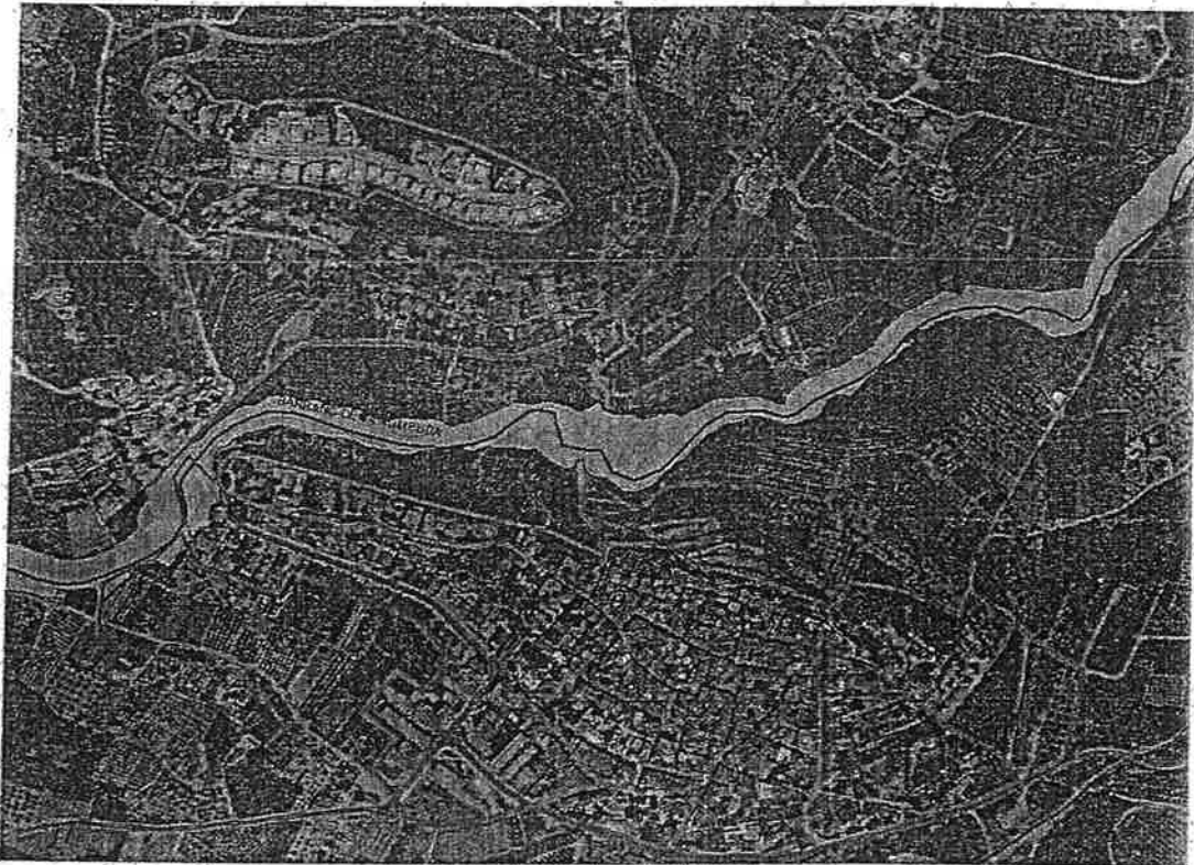
Figura 21. Clasificación del suelo

De acuerdo con lo dispuesto en el artículo 9 del Reglamento del Dominio Público Hidráulico R.D. 849/1986, en la zona de flujo preferente de los cauces no pueden autorizarse actividades vulnerables frente a las avenidas ni actividades que supongan una reducción significativa de la capacidad de desagüe de la citada zona de flujo preferente.